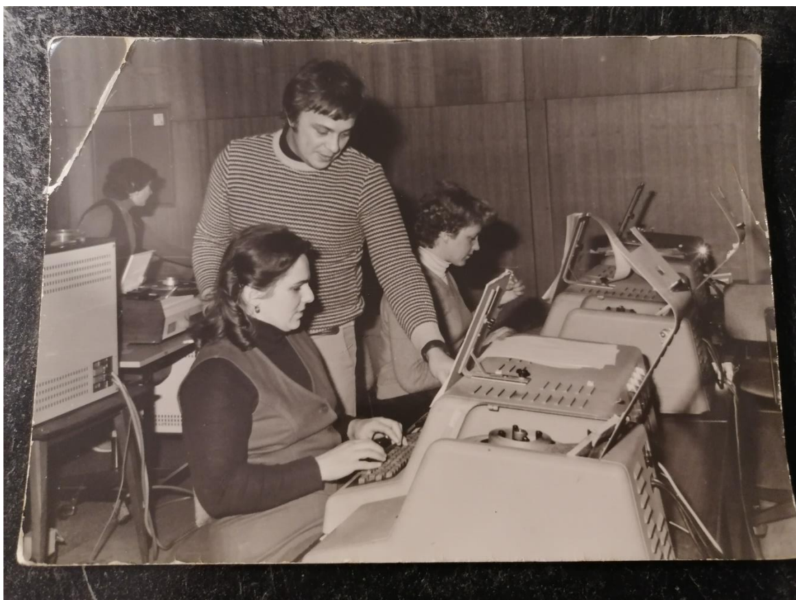
Na sliki moja mama in sodelavke, ki delajo na enih 1. računalnikov v Sloveniji.