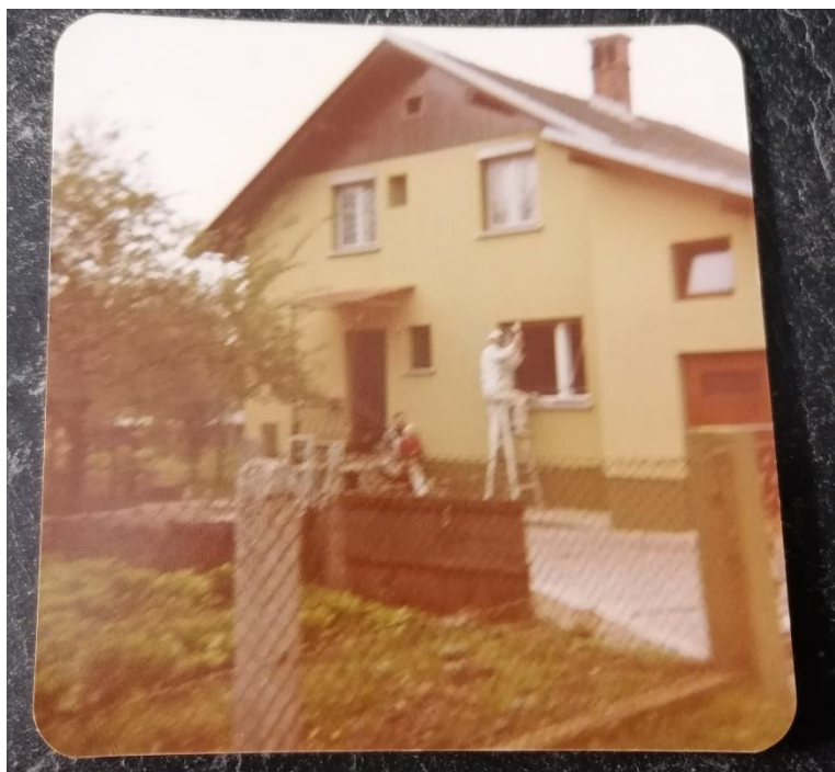
Barvanje hiše pred prib. 45 leti.