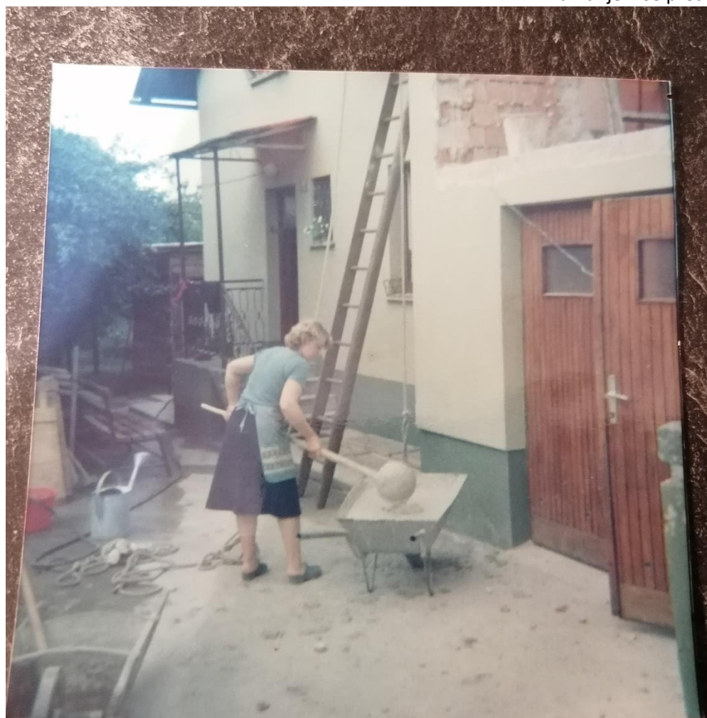
Dozidavanje hiše moje ate in mame pred 50. leti.