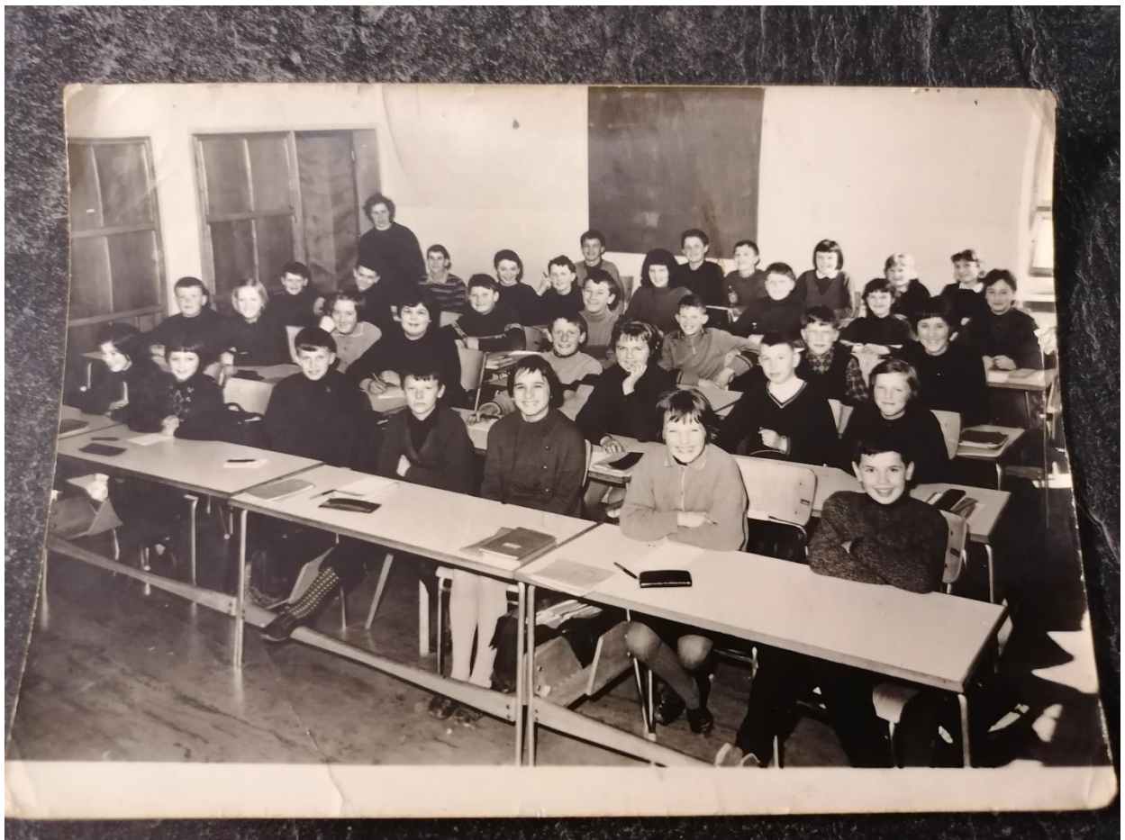
Na sliki razred moje mame v Besnici pred 55. leti.