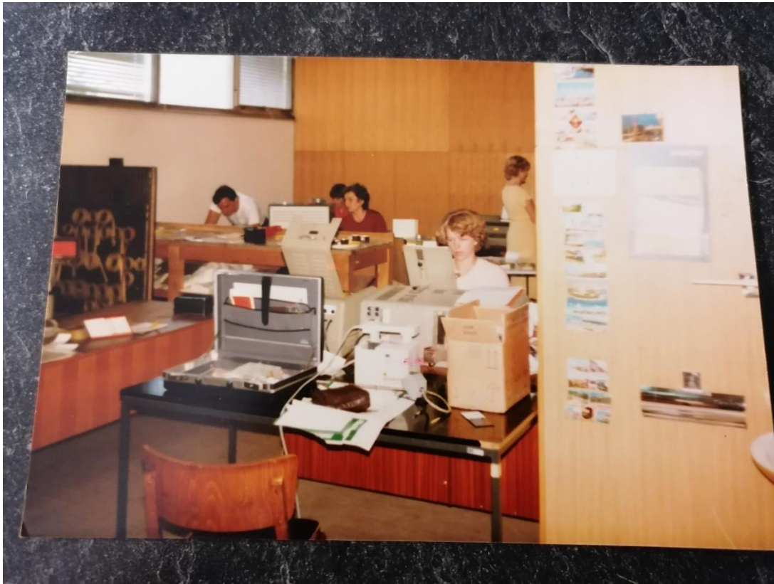
Delo na računalnikih pred približno 40. leti.