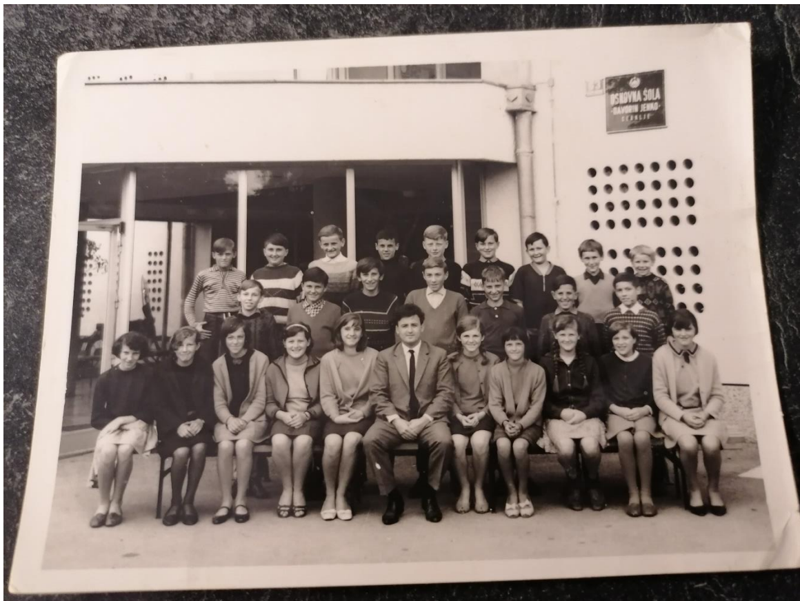
Na sliki razred mojega ata, ko je hodil v OŠ Davorina Jenka pred 55. leti.