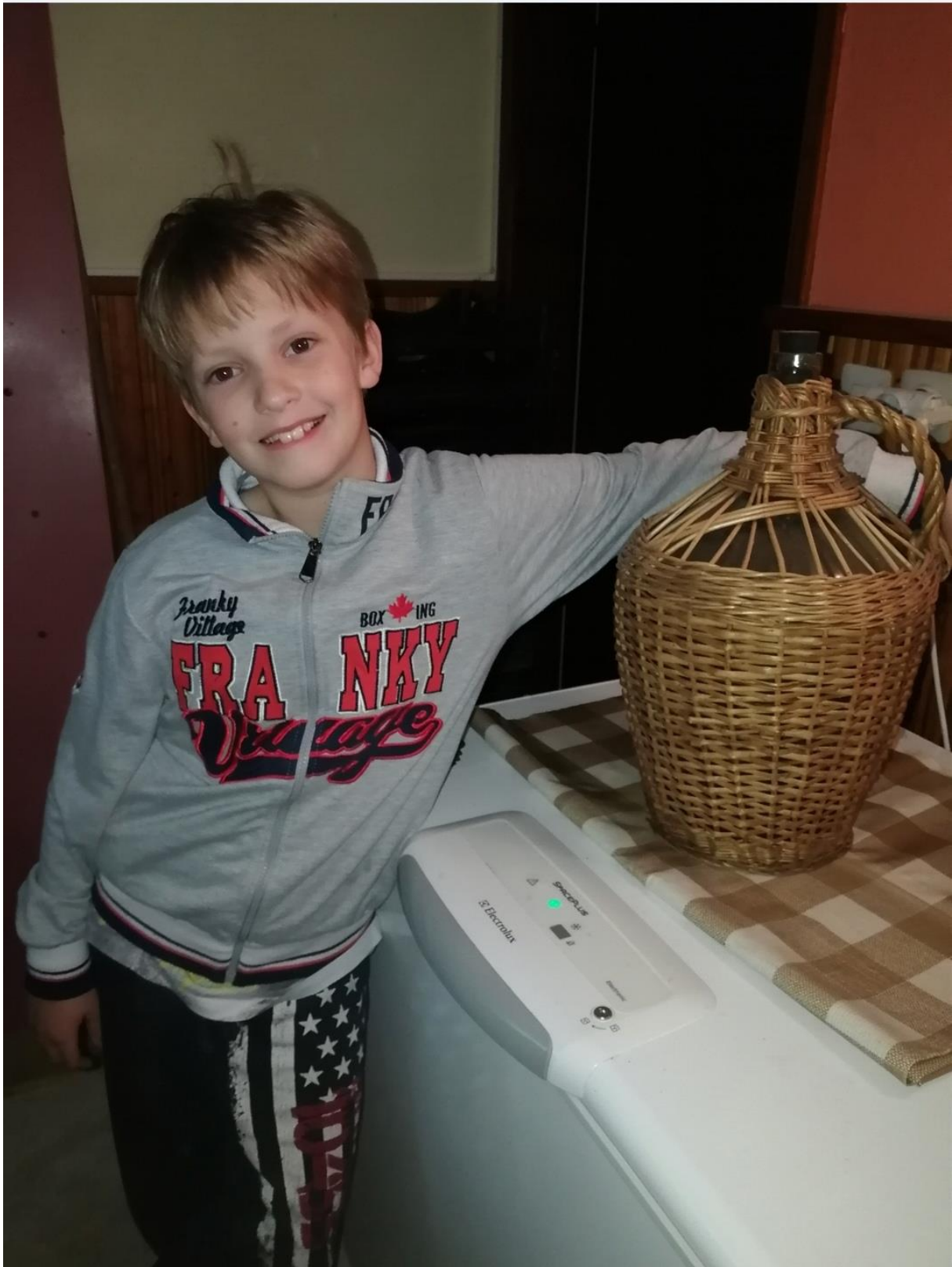
Še jaz pred 4 leti s starimi predmeti, ki jih zelo spoštujem.